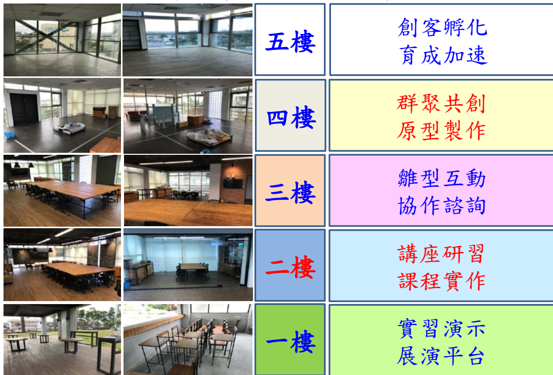
圖 2. I-MAKER@NTTU 各樓層配置示意圖。

決定：提送產學營運及推廣教育委員會審議及針對收費金額是否合宜充分討論後，併入產學暨推廣教育處場館借用管理要點提案送行政會議修正。